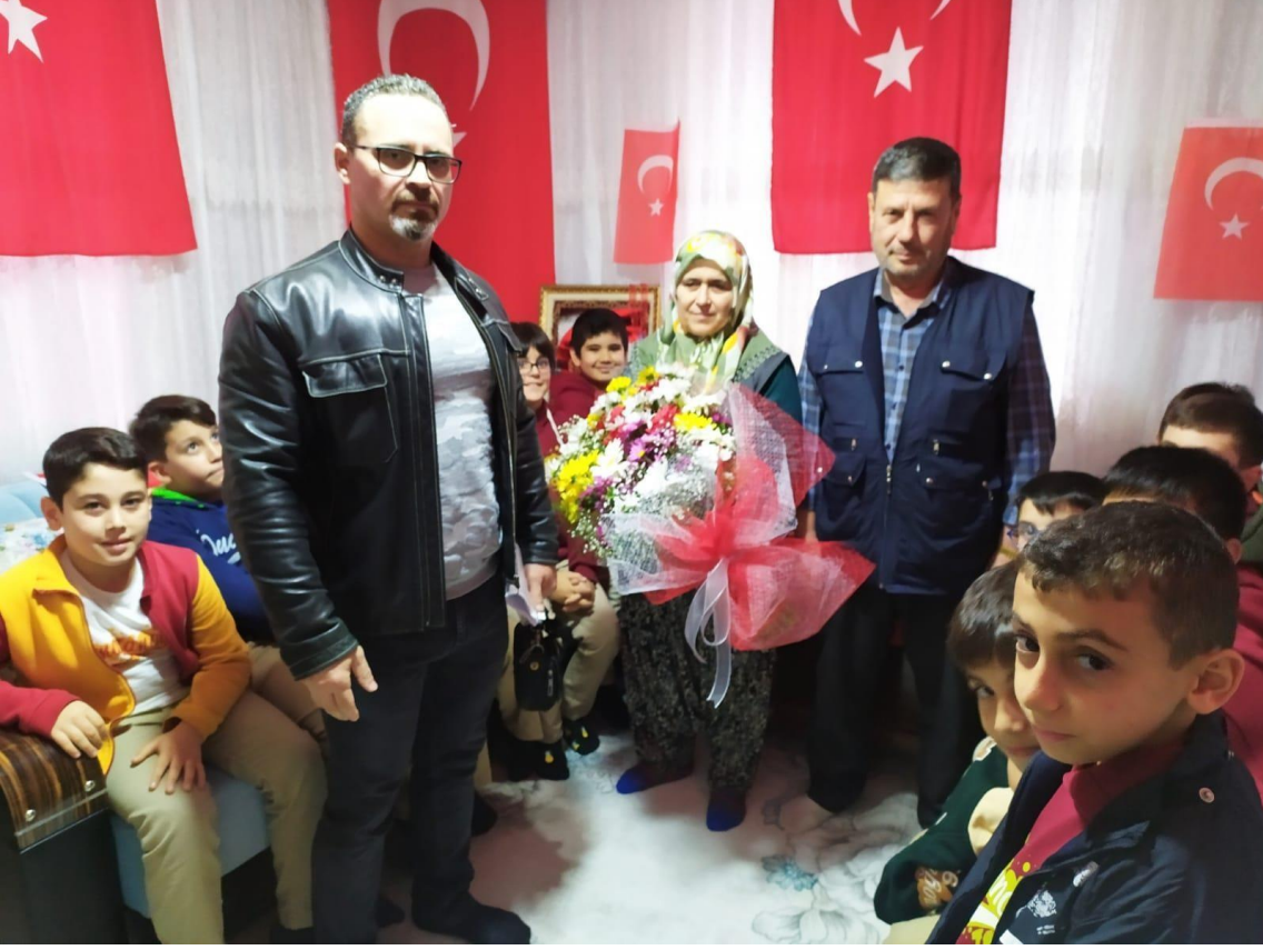
Şehidimizin annesine çiçek takdim edilmiştir.